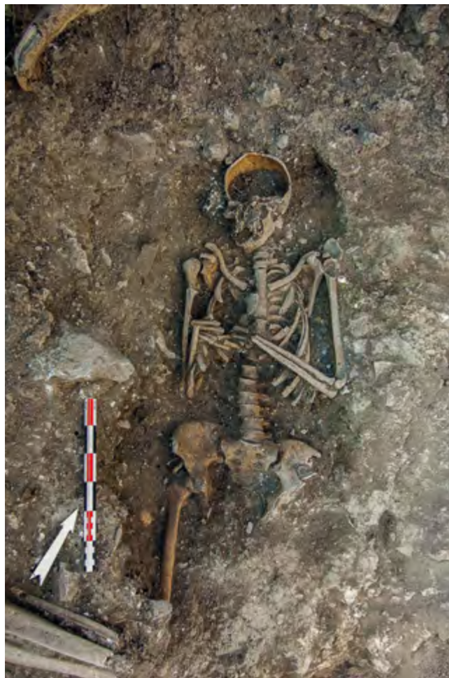
Fig. 67 – LEVENS, 160, chemin de la Madone. Vue en plan des éléments conservés de la sépulture sous tegulae SP18.

Lors de l'opération archéologique, 7 sépultures ont été reconnues, et six d'entre elles (dont la conservation était menacée par l'aménagement) ont été prélevées.